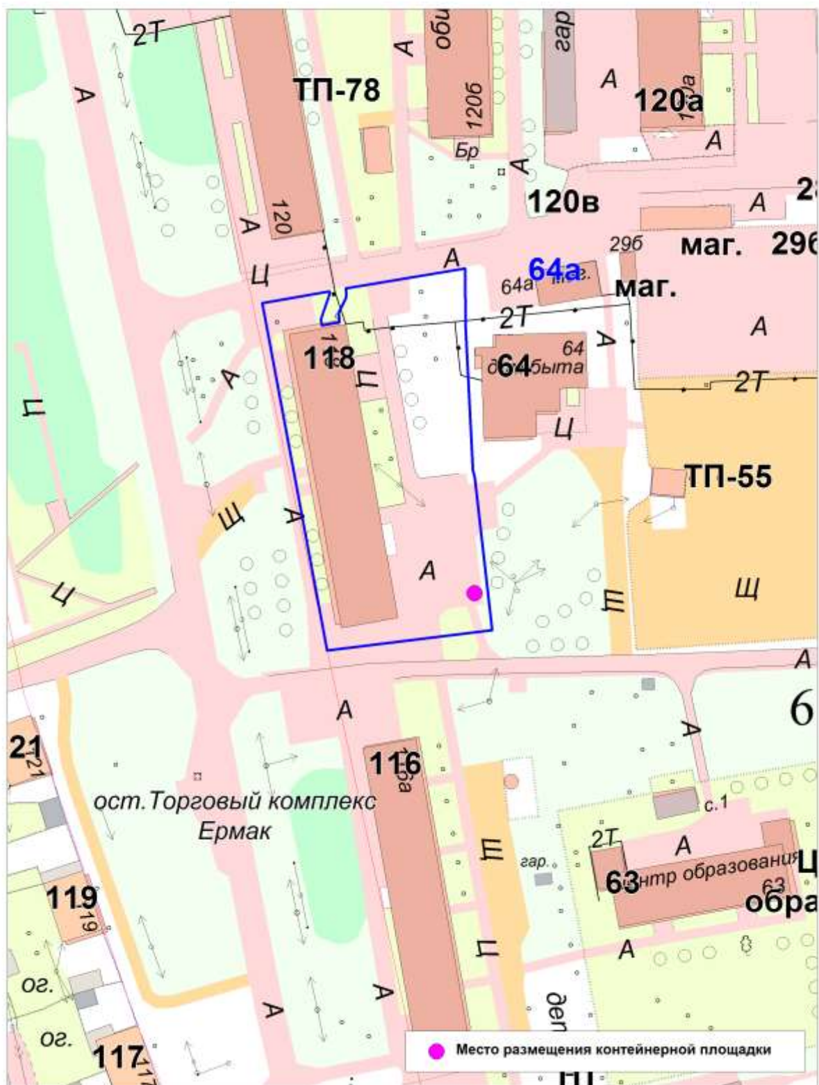
Схема размещения контейнерной площадки по адресу: Тюменская область, г.Тобольск, 6 мкр., д.118