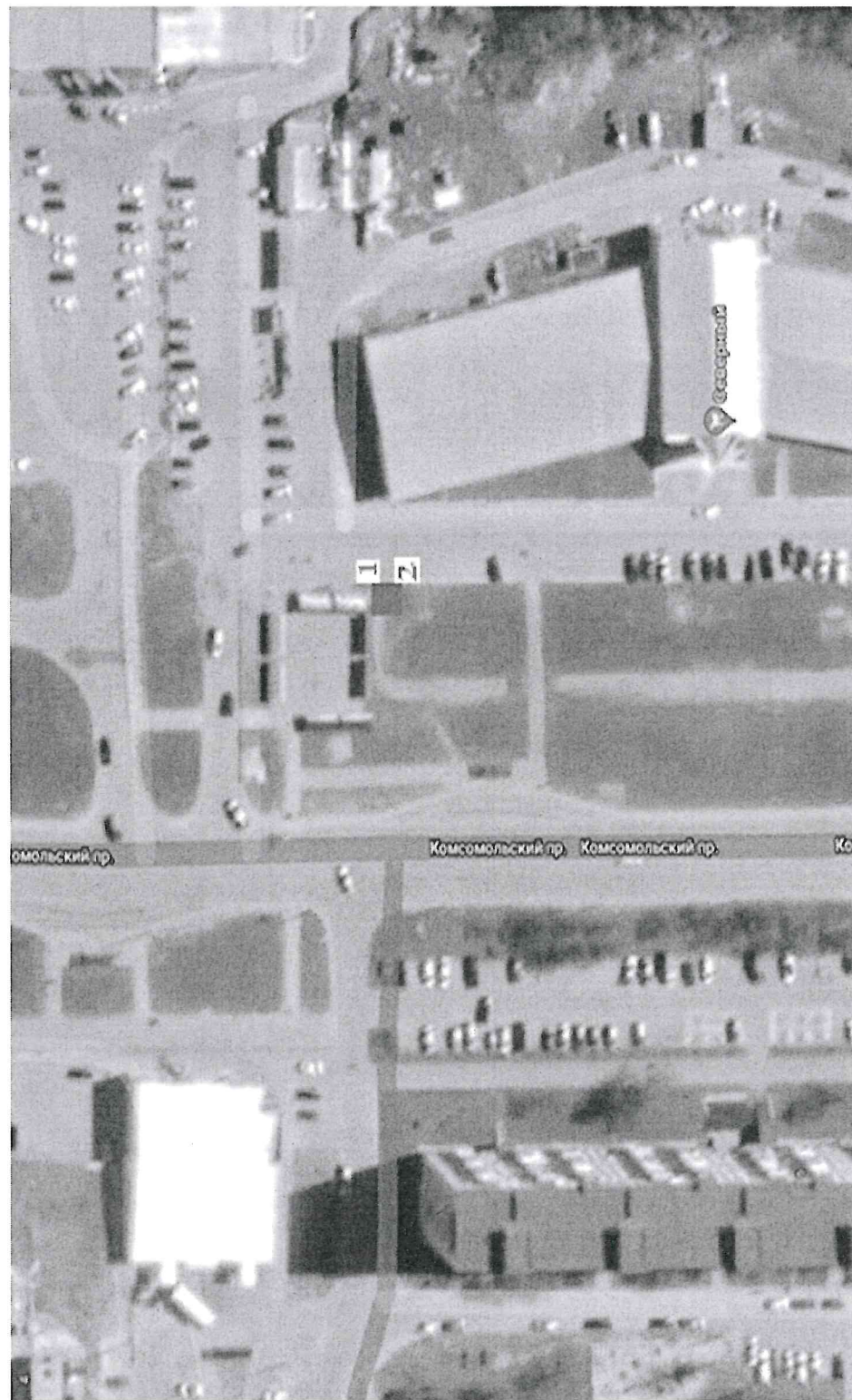
Схема размещения торговых мест на специализированной Ярмарке «Новогодние деревья» район торгового комплекса «Северный», территория Зона ВУЗов, 2, город Тобольск

Приложение 3 к Порядку организации специализированной Ярмарки «Новогодние деревья»