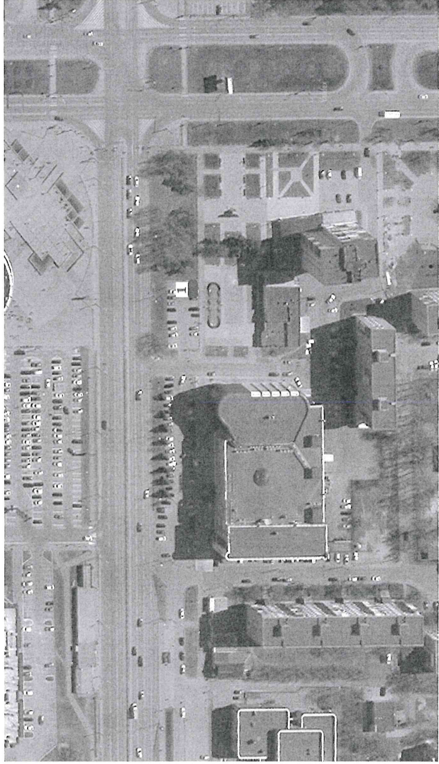
Схема размещения торговых мест на специализированной Ярмарке «Новогодние деревья» территория перед строением 53а, микрорайон 6, город Тобольск (парковка)

Приложение 5 к Порядку организации специализированной Ярмарки «Новогодние деревья»