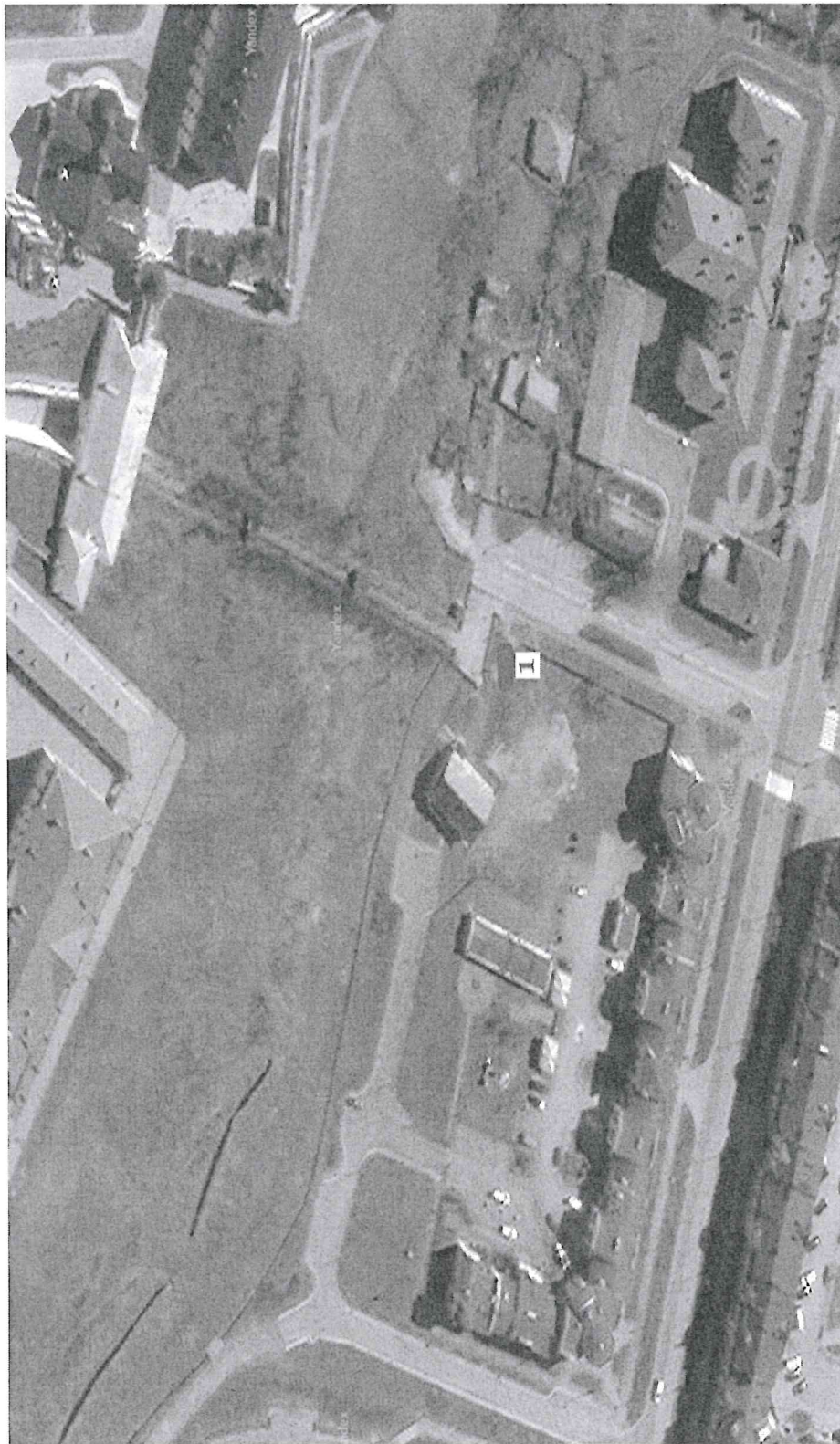
Схема размещения торговых мест на специализированной Ярмарке «Новогодние деревья» территория здания Богдельни, ул. Розы Люксембург, стр.1, город Тобольск

Приложение 2 к Порядку организации специализированной Ярмарки «Новогодние деревья»