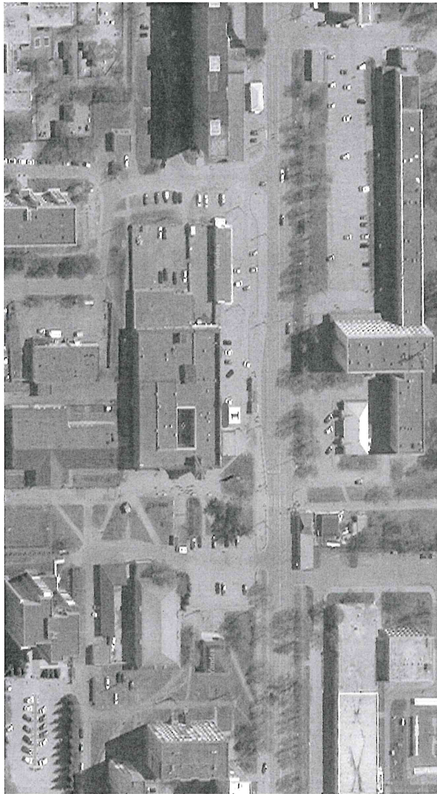
Схема размещения торговых мест на специализированной Ярмарке «Новогодние деревья» территория торгового центра «Универмаг «Тобольский», ул. Мельникова, строение 8, город Тобольск

Приложение 7 к Порядку организации специализированной Ярмарки «Новогодние деревья»