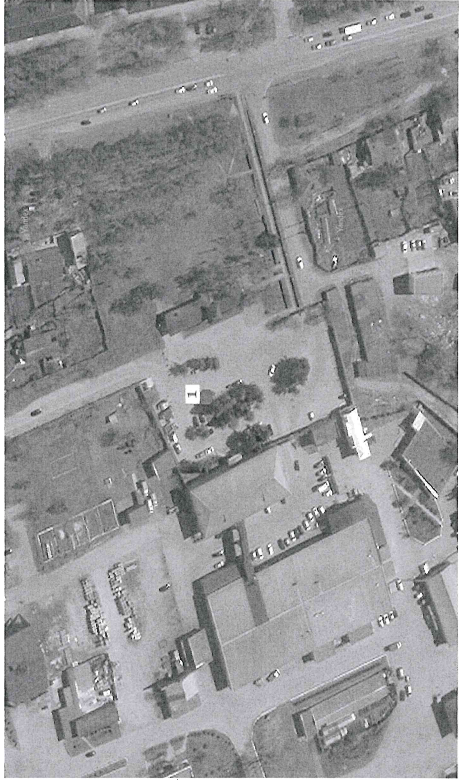
Схема размещения торговых мест на специализированной Ярмарке «Новогодние деревья» территория Торгового комплекса «Ермак», ул. С. Ремезова, 123, город Тобольск

Приложение 6 к Порядку организации специализированной Ярмарки «Новогодние деревья»