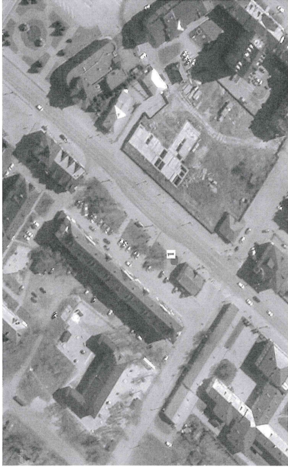
Схема размещения торговых мест на специализированной ярмарке «Новогодние деревья» территория напротив магазина «Ильинский», ул. Семена Ремезова, д. 17, город Тобольск

Приложение 8 к Порядку организации специализированной Ярмарки «Новогодние деревья»