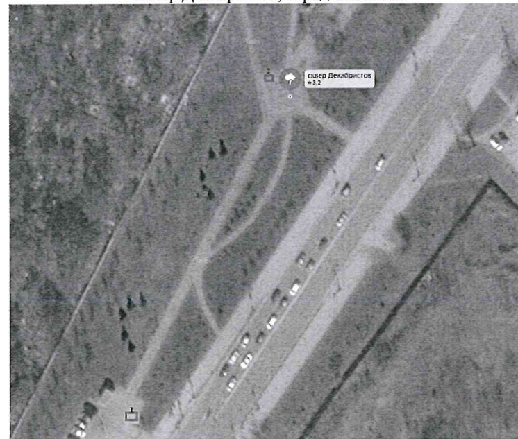
Схема размещения торговых мест на универсальной ярмарке «Ералаш» Сквер Декабристов, город Тобольск

Приложение 3 к Порядку организации универсальной ярмарки «Ералаш» от _____ № _____