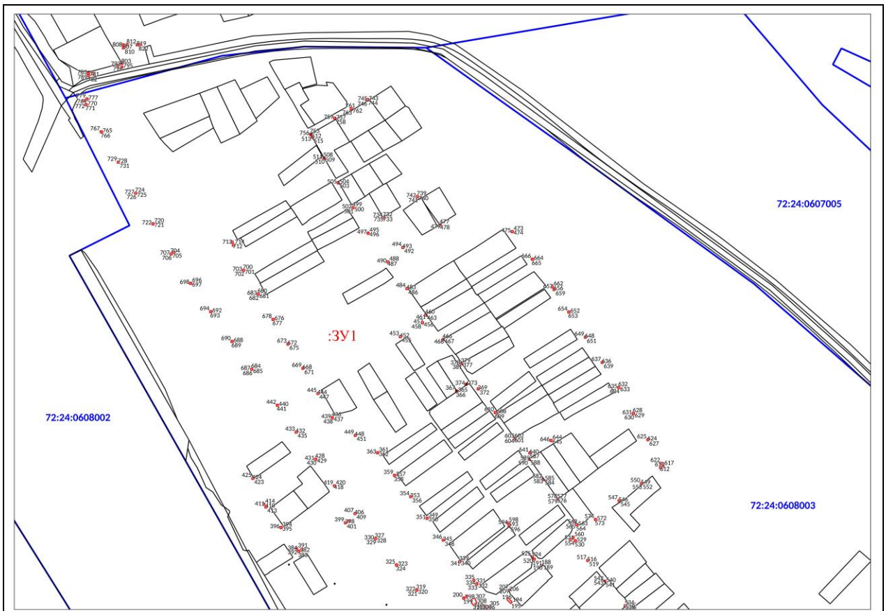
Мащтаб 1: 3000