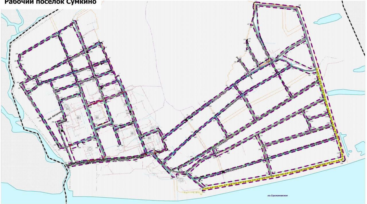
Схема границы проекта планировки улично-дорожной сети в границах элементов планировочной структуры М 1:25 000