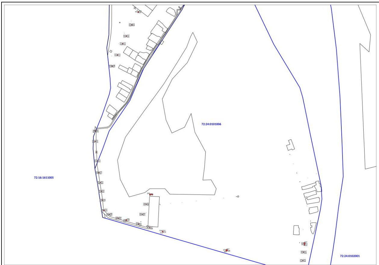
Масштаб 1: 5000