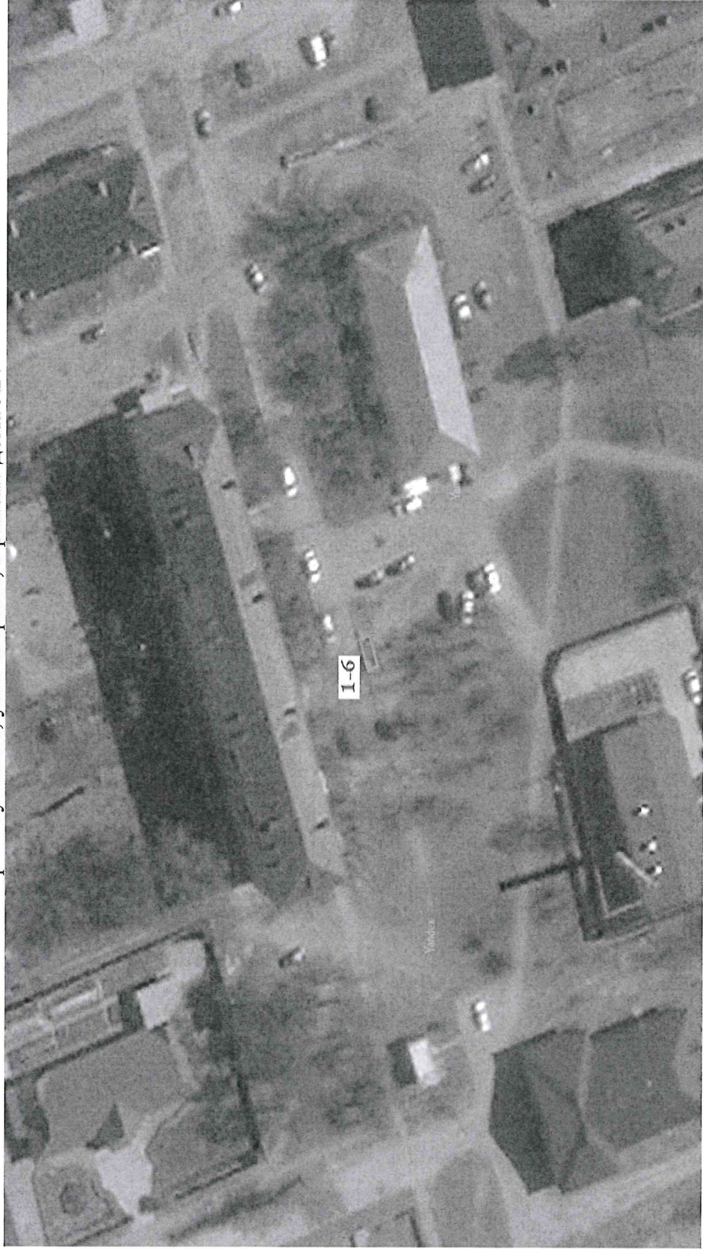
Схема размещения торговых мест на универсальной ярмарке «Гобольская муниципальная ярмарка» р.п. Сумкино, ул. Гагарина, в районе дома №4