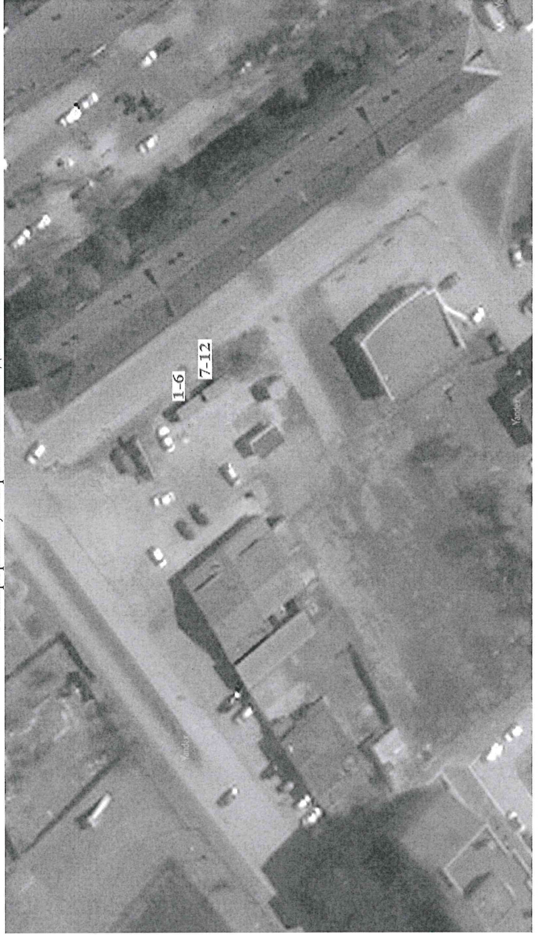
Схема размещения торговых мест на универсальной ярмарке «Тобольская муниципальная ярмарка» 4 микрорайон, напротив жилого дома №1