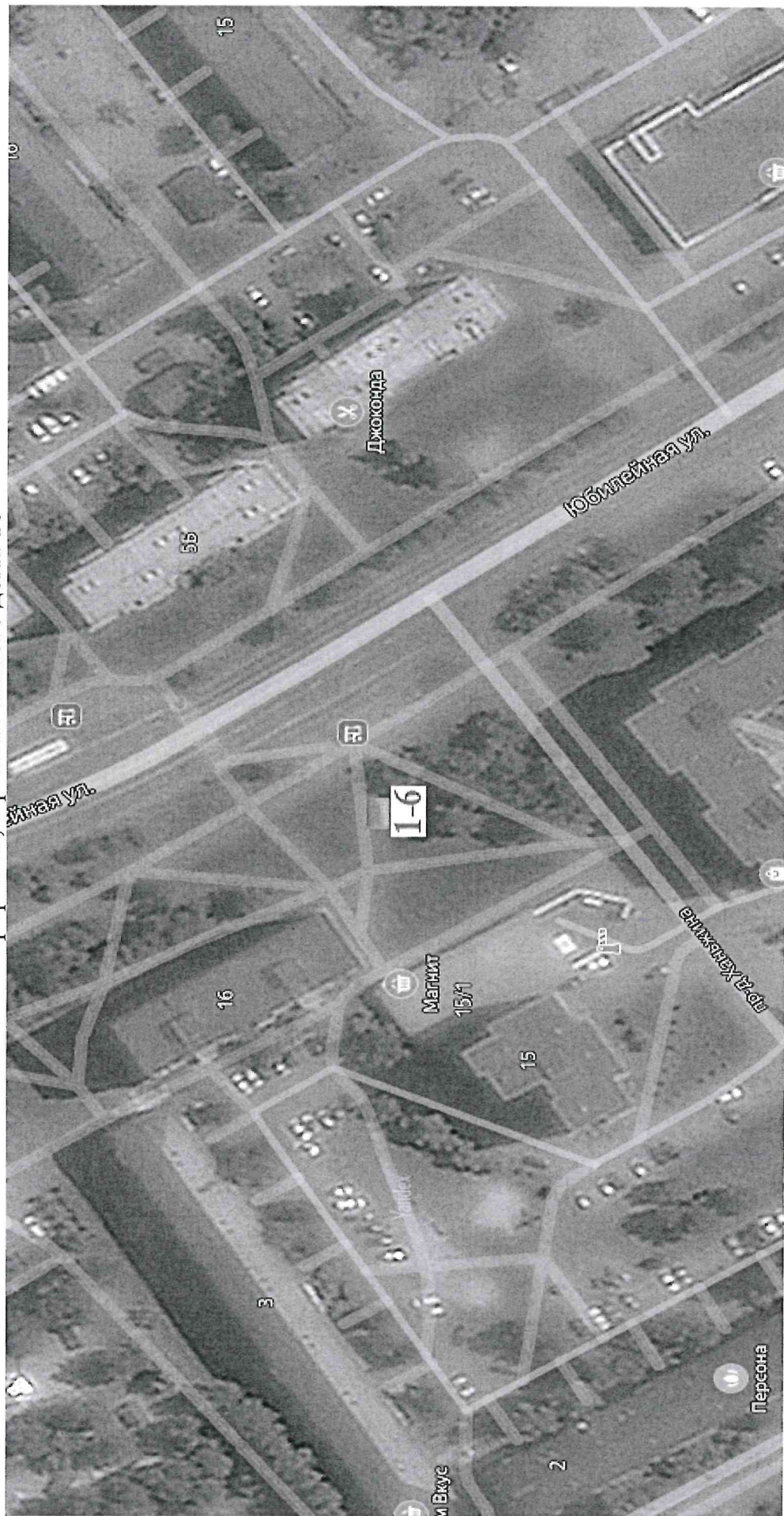
Схема размещения торговых мест на универсальной ярмарке «Тобольская муниципальная ярмарка» 4 микрорайон, в районе жилого дома 16