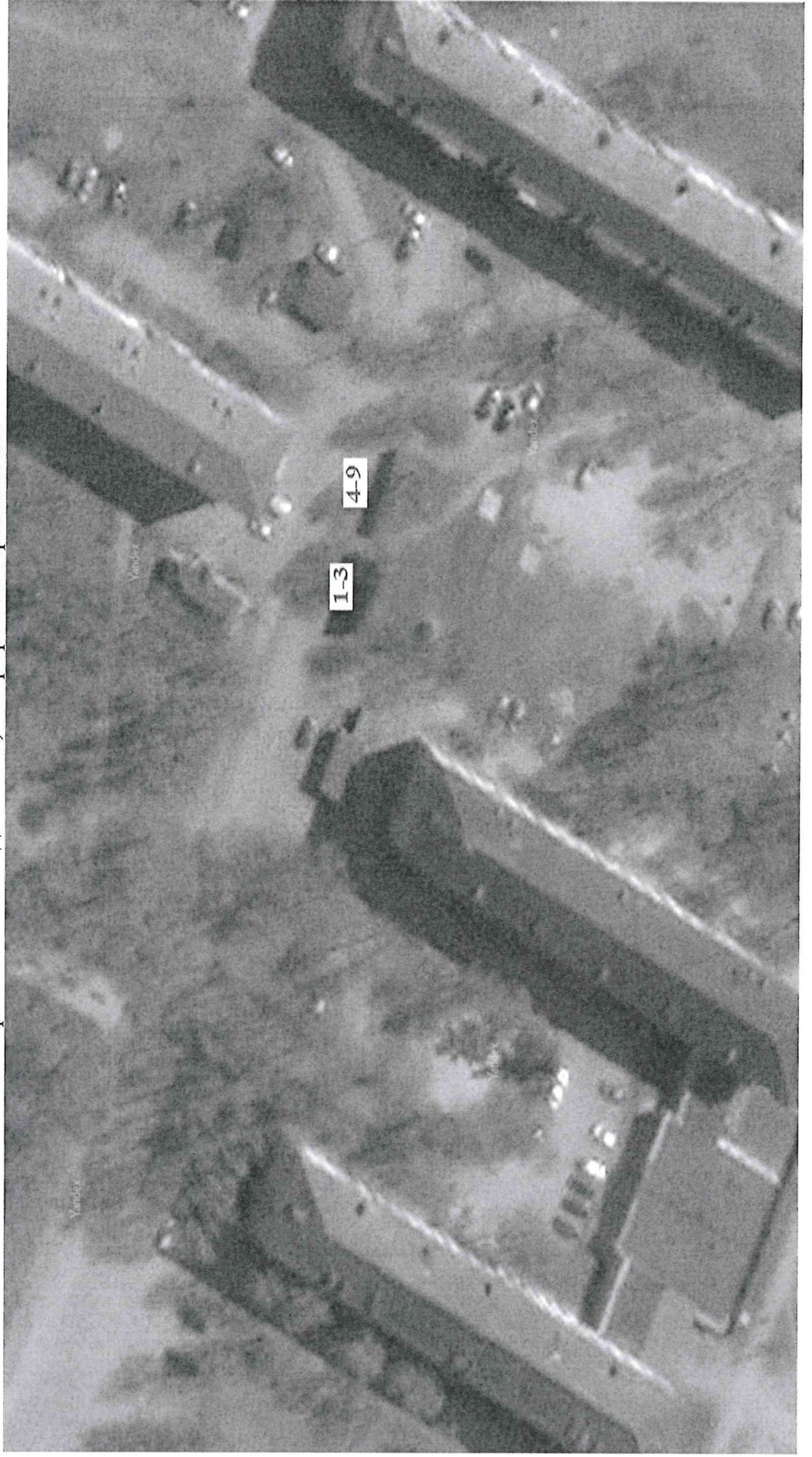
Схема размещения торговых мест на универсальной ярмарке «Тобольская муниципальная ярмарка» район жилого дома №4, микрорайон Иртышский