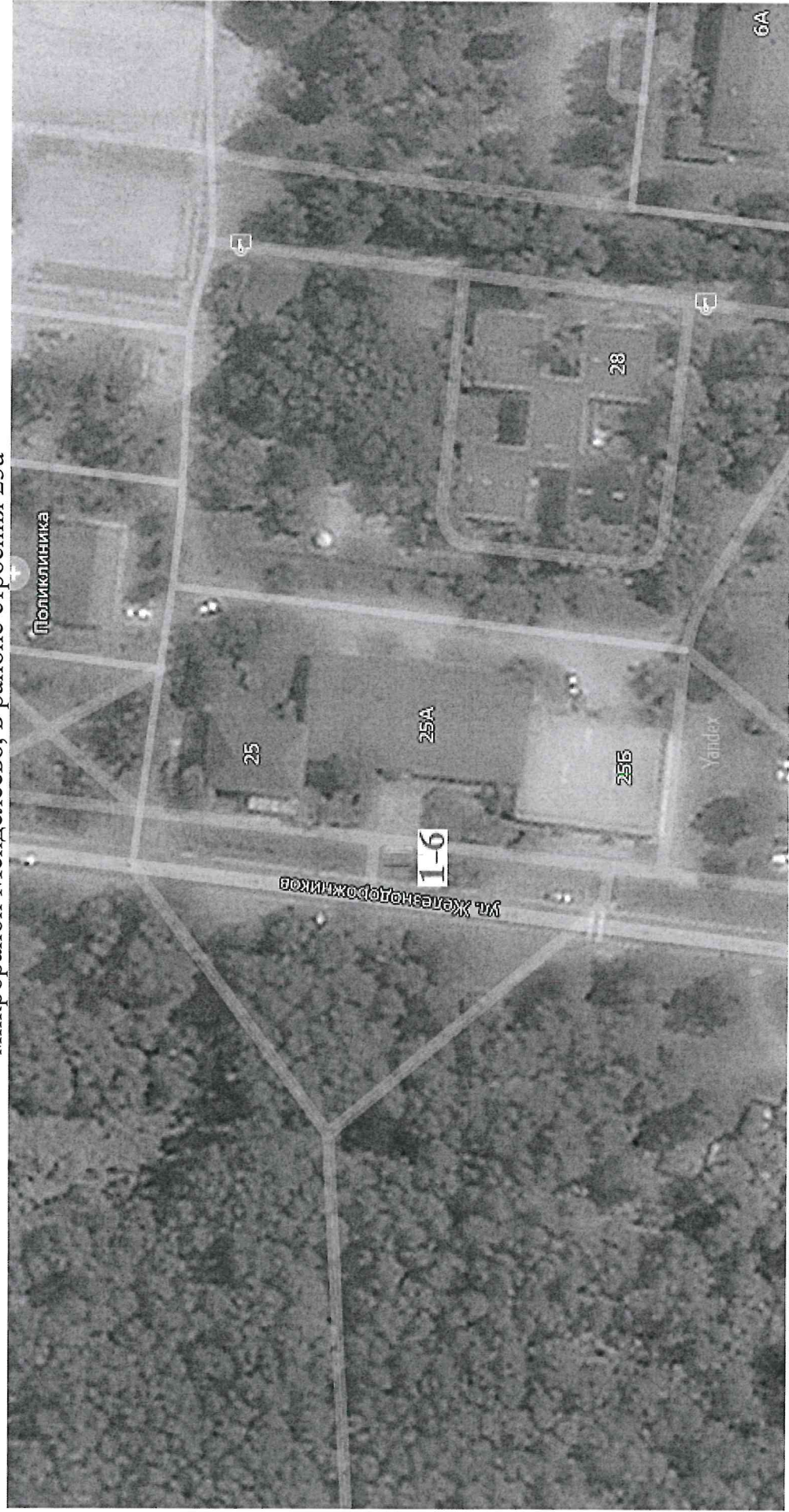
Схема размещения торговых мест на универсальной ярмарке «Гобольская муниципальная ярмарка» микрорайон Менделеево, в районе строения 25а