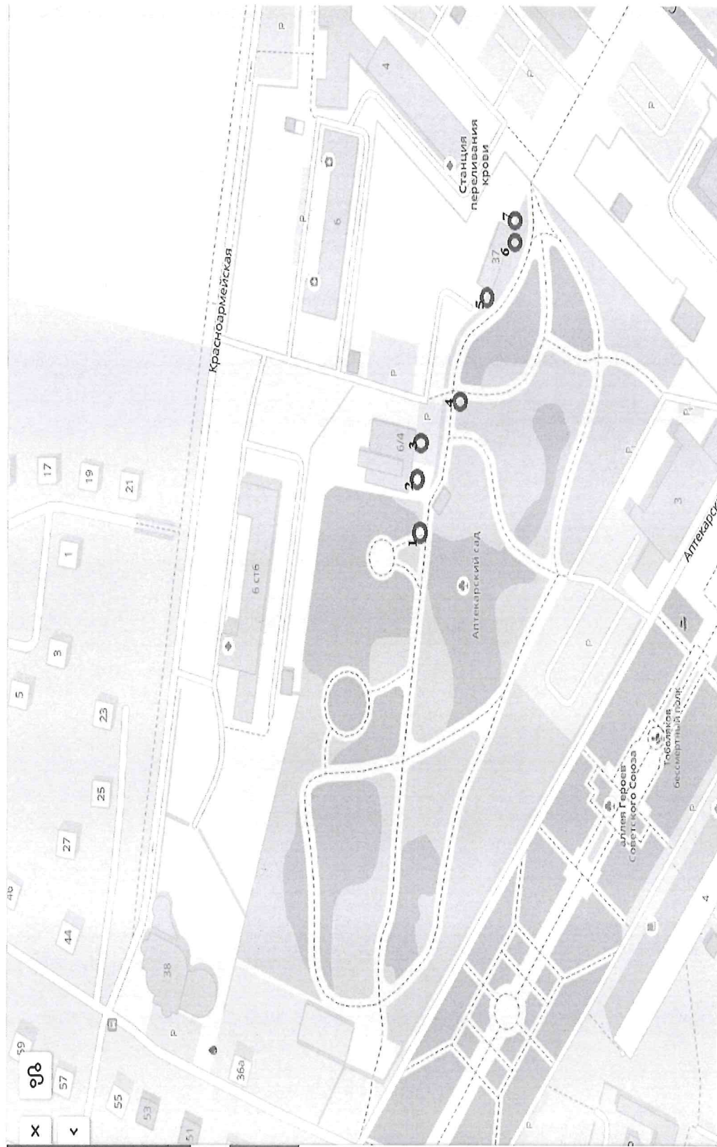
Схема размещения торговых мест в месте проведения Аптекарский сад